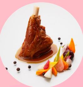
Souris d'agneau fondante et son jus au thym citronné