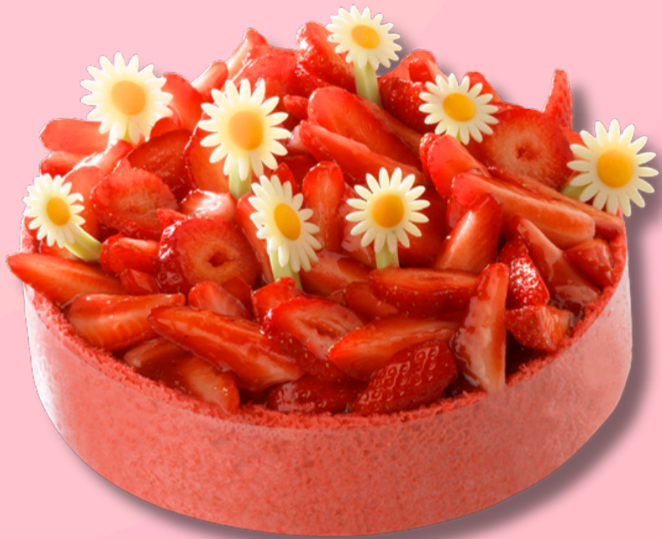
Charlotte Fraise Vanille